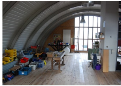
→ atelier →