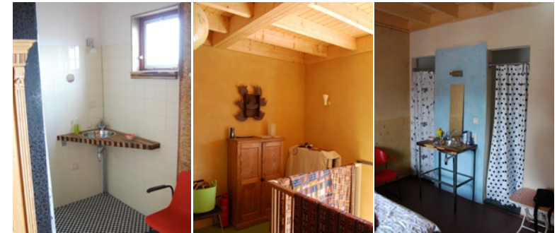
↑ voorgevel → interieur